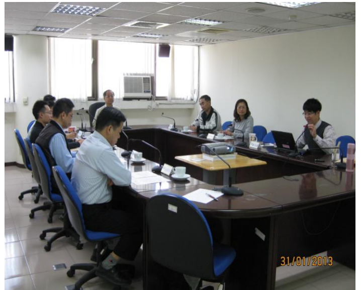
廉政委員出席情形