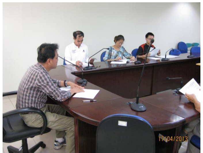
廉政委員出席情形